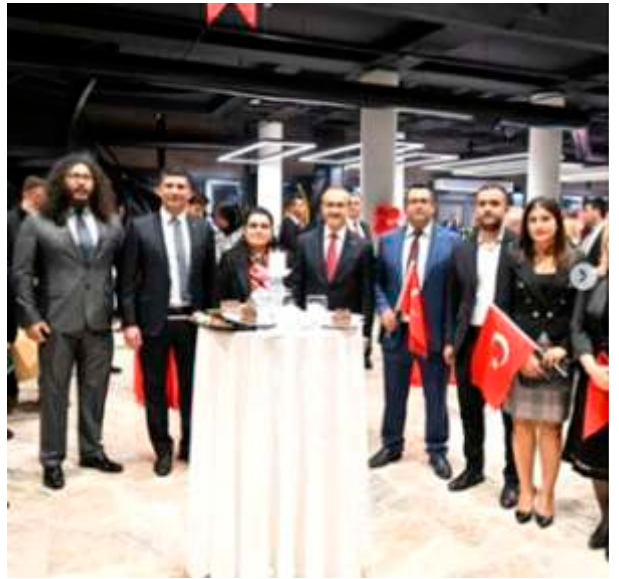
29 Ekim Cumhuriyet Bayramının 99. Yılıni, laikliğin ve bilimin aydınlatıcılığında kamu-toplum yararının hakim olduğu, planlama-sanayileşme-kalkınma-tam istihdam-toplumsal refah bütünlüğünün sağlandığı, ülkede-bölgede-dünyada barış politikasının esas alındığı, halk egemenliğindeki bir Türkiye özlemiyle coşkuyla kutladık.