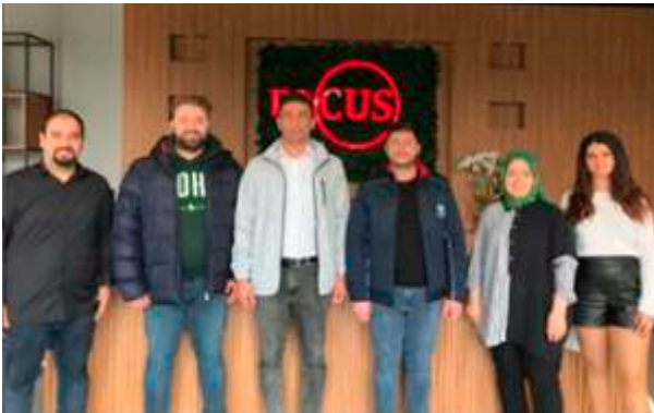
Perşembe günleri üye ve işyeri ziyaretleri kapsamında Focus endüstriyel firmasındaki meslektaşlarımızı ziyaret ettik.