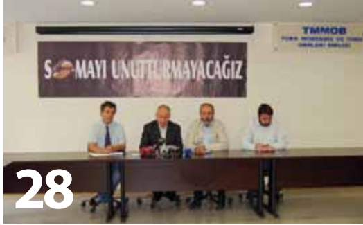
TMMOB SOMA MADEN FACİASI RAPORU AÇIKLANDI