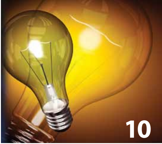
ELEKTRİK VE DOĞALGAZA YAPILAN ZAMLAR