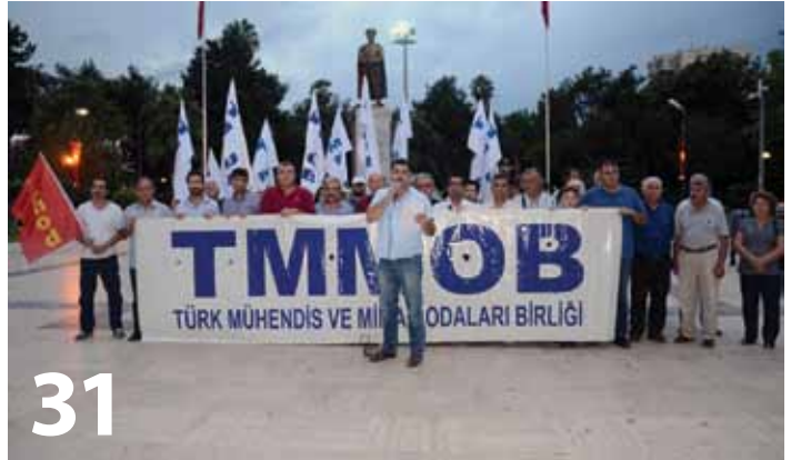
MÜHENDİS, MİMAR, ŞEHİR PLANCILAR 19 EYLÜL'DE ALANLARDAYDI