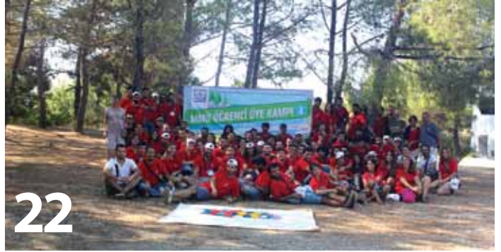
MMO ÖĞRENCİ ÜYE KAMP'İ 2014 BAŞARIYLA TAMAMLANDI