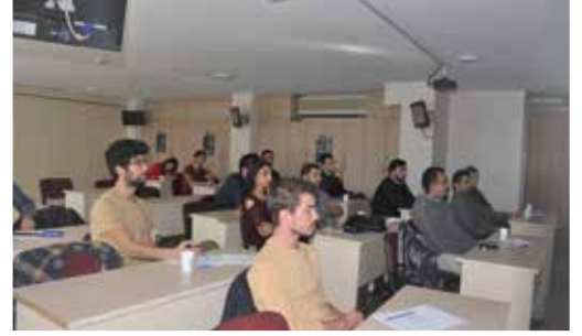
Yiğit İmece: Yalın Üretim