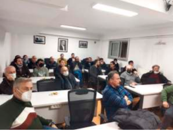
Makine Mühendisleri Odası Düzce İl Temsilciliği Üye Eğilim Belirleme toplantısı 31 üyenin katılımıyla Düzce Temsilcilik binası eğitim salonunda gerçekleştirildi.