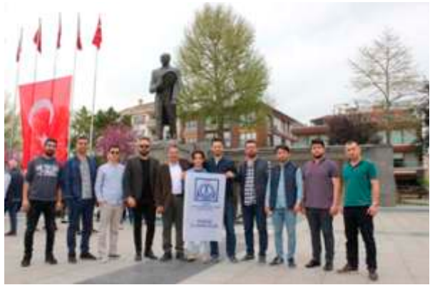
23 Nisan Ulusal Egemenlik ve Çocuk Bayramı Düzce Anıtpark'ta kutlandı.