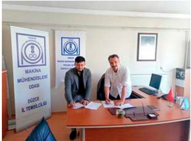
Düzce Amerikan Kültür Yabancı Dil Okulu ile üyelerimiz ve birinci derece yakınlarını kapsayan protokol imzalandı.