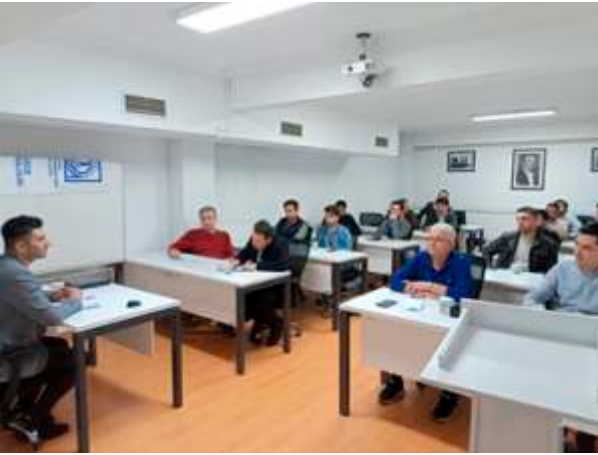
Makine Mühendisleri Odası Düzce İl Temsilciliği 2. Üye Eğilim Belirleme Toplantısı Temsilcilik Yürütme Kurulunun Belirlenmesi Gündemi İle 18 Üyenin Katılımıyla Temsilcilik Binası Eğitim Salonunda Gerçekleştirildi.