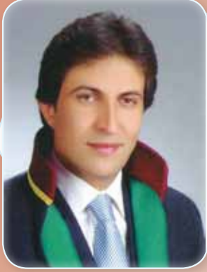
Av. Ramazan BEDİR