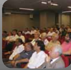
Danışma Kurulu Toplantısı