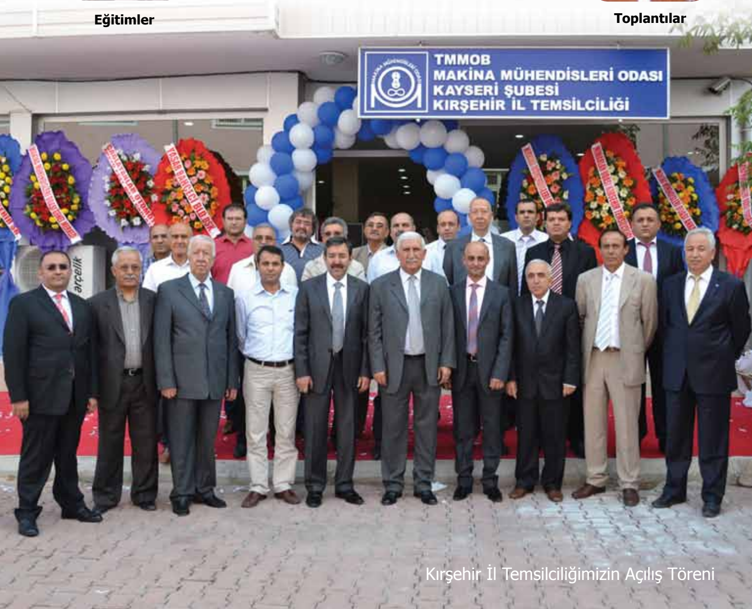
Kırşehir İl Temsilciliğimizin Açılış Töreni