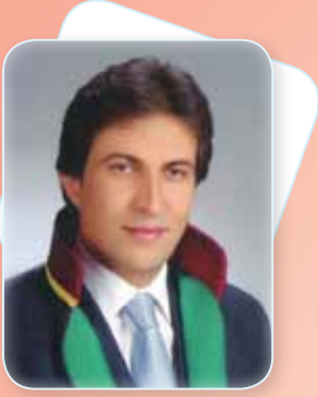
Av. Ramazan BEDİR